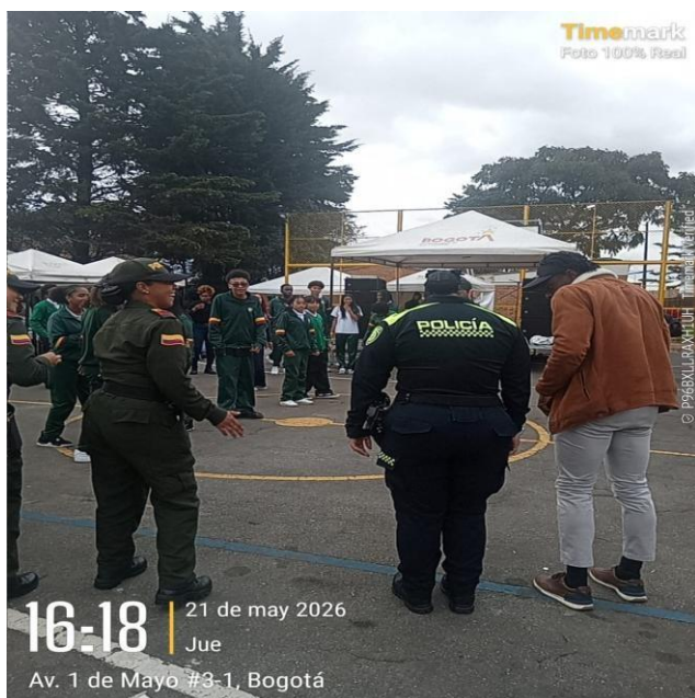
Foto 8: Quilombos (Estrategia de la Secretaría Distrital de Salud orientada a la promoción de la salud, el reconocimiento étnico y el fortalecimiento de acciones diferenciales dirigidas a comunidades negras, afrocolombianas, raizales y palenqueras).